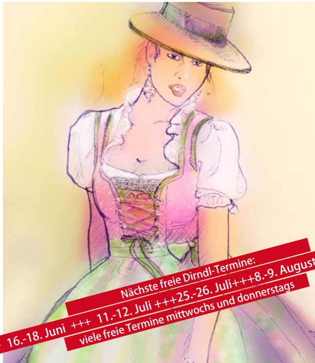
Illustration Albert P.schorr

Nächste freie Dirndl-Termine: + 16.-18. Juni +++ 11.-12. Juli +++ 25.-26. Juli +++ 8.-9. August + viele freie Termine mittwochs und donnerstags